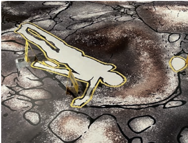
Die Fundsituation in den Ötztaler Alpen wird als Tatort nachgestellt.

Eine tödliche Begegnung in den Ötztaler Alpen vor rund 5300 Jahren bescherte der Wissenschaft einen Sensationsfund: Ötzi. Der Körper des Mannes aus der Kupferzeit überdauerte die Zeit bis zu seiner zufälligen Entdeckung im Jahr 1991 im Gletschereis. Was verrät seine Kleidung, was erzählen seine Werkzeuge und Waffen und welche Geheimnisse gibt sein Körper preis? Noch heute, mehr als 30 Jahre nach seinem Fund, beschäftigt sich die Wissenschaft mit dem Lösen der Rätsel um Ötzi. Erst kürzlich wurden Forschungsergebnisse zu Ötzis Genetik veröffentlicht, die neue Rückschlüsse auf sein Aussehen ermöglichen.