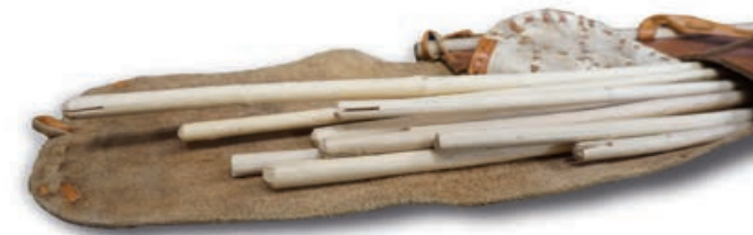
Ein Köcher mit Pfeilen wurde bei Ötzi gefunden. Der Nachbau zeigt, wie er gefertigt wurde.