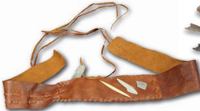
Nach dem Original gefertigter Gürtel, wie Ötzi ihn trug.