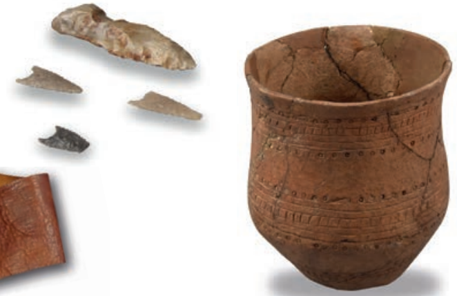
Steinzeitlicher Glockenbecher, Flintdolch und Pfeilspitzen aus Flint. Ein Fund aus Neuenkrüge, Landkreis Ammerland